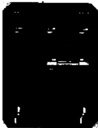
Netzspannungswähler Voltage Selector Sélecteur de tension

Zur Bandaufnahme und -wiedergabe verbinden Sie Ihr Tonbandgerät mit derselben Normbuchse an der Rückseite des Empfängers. Es wird hierzu ein Kabel mit Normsteckern verwendet, welches gleichzeitig für Aufnahme und Wiedergabe dient. Bei der Wiedergabe von Tonbandaufnahmen ist die Taste „TA“ zu drücken. Beachten Sie bitte bei Tonbandaufnahmen den „Hinweis auf Urheberrechte“ in unseren Tonbandgeräte-Bedienungsanleitungen.