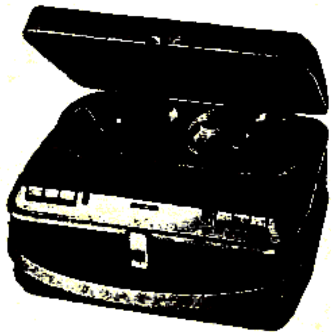
TK 19 Automatic

GRUNDIG Tonbandgeräte gibt es in allen Preisklassen, für jeden Zweck und alle Ansprüche. In der neuesten GRUNDIG Tonbandfibel – bei Ihrem Fachhändler erhältlich – finden Sie alles Wissenswerte über diese Geräte.